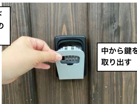
中から鍵を取り出す