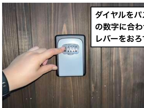
ダイヤルをパスワードの数字に合わせ、左のレバーをおろす