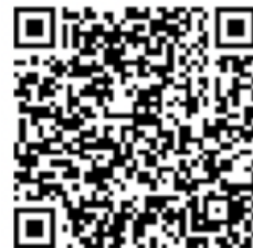
登録専用フォーム

専用フォームにて登録 (推奨) : https://pro.form-mailer.jp/fms/88c9c5ce255180