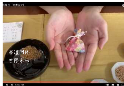
オリジナルの匂い袋の作り方をyoutubeで公開