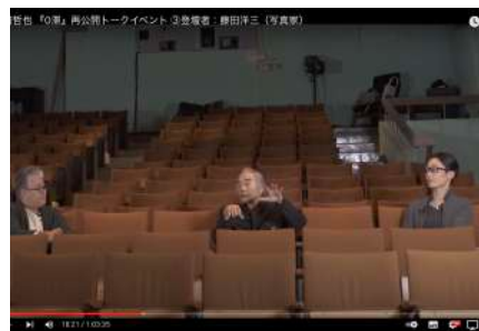
トークイベントをYouTubeにて配信