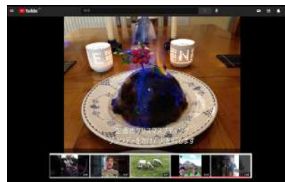
自国の文化を紹介する動画を毎日配信