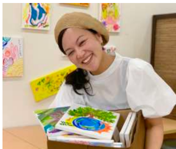
日ごろ描きためた絵の展示