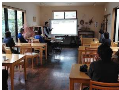
カフェを会場にトークイベントを開催