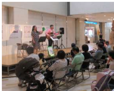
デパートの特設ステージでの子どものためのジャズライブ