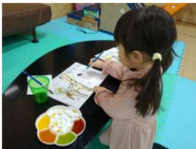
野菜で絵の具を作って楽しくお絵かき