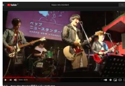
音楽ライブの生配信