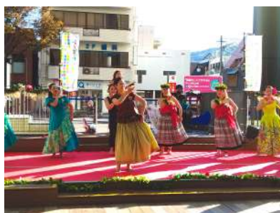
子どもから大人まで幅広い世代がダンスを披露