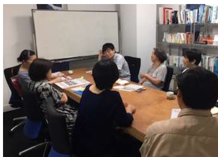
『ベップ・アート・マンスをつくろう会』の様子

オンラインイベントに関するサポートについては、別紙1『オンライン上でのプログラム実施に関するサポート』をご覧ください。