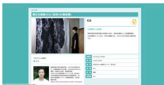
Webサイトでのプログラム紹介(写真は2022年度版)