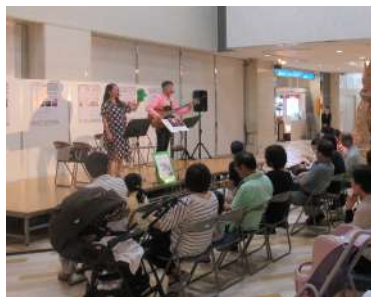
デパートの特設ステージでの子どものためのジャズライブ