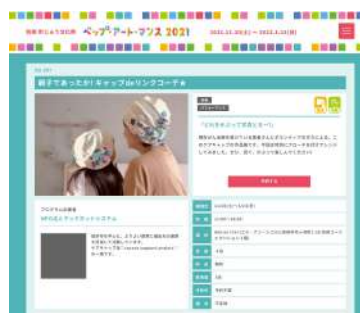
Webサイトでのプログラム紹介（写真は2021年度版）